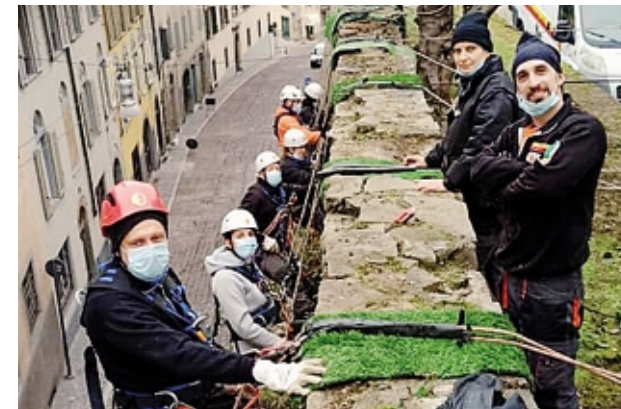
I volontari al lavoro sul tratto di mura medievali